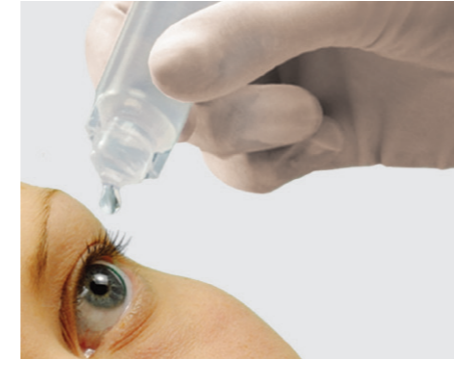
Punkt förmige Anwendung: Der 30-ml-Minidosis-Behälter erlaubt eine auf den Punkt genaue Anwendung der Spüllösung.