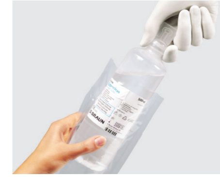
Estericlean® (500 ml) Sterile Spüllösung mit Schutzverpackung

Flexibler Spülbehälter für punktgenaue, effiziente Anwendungen