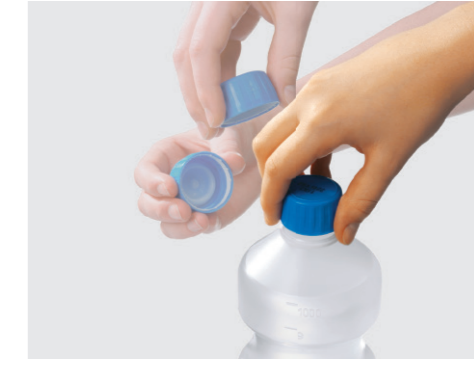
Die farbcodierten Verschlusskappen sind leicht zu öffnen. Und der weiße Versiegelungsring ist eine sichtbare Garantie für die Originalität der Spüllösung.