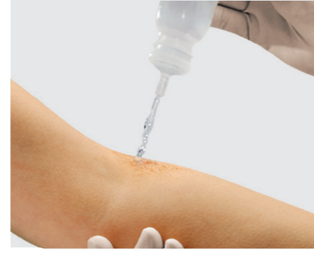
Druckanwendung: Ein geringer Druck auf die weiche Flasche bewirkt einen feinen, präzisen Strahl der Spüllösung.

Mit sanftem Druck präzise spülen ... und dabei Zeit und Kosten sparen