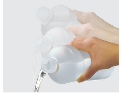
Die spezielle Form des Ecotainers hilft, dass beim Ausgießen der Spüllösung kein Tropfen daneben geht – auch bei voll gefülltem Behälter und steilem Ausgusswinkel. Zusätzlich sorgt die Messskala für eine exakte Dosierung je nach Anwendungsgebiet.