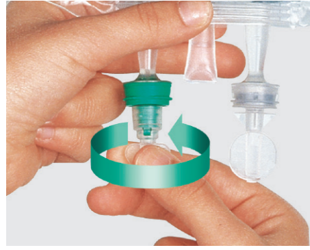
Portsystem durch Abdrehen der Verschlusskappe öffnen.

Immer die beste Verbindung ... passt sich jeder Bewegung an