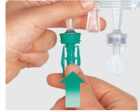
Ecoclick®-Konnektor bis zur Rastung in den Port drücken.